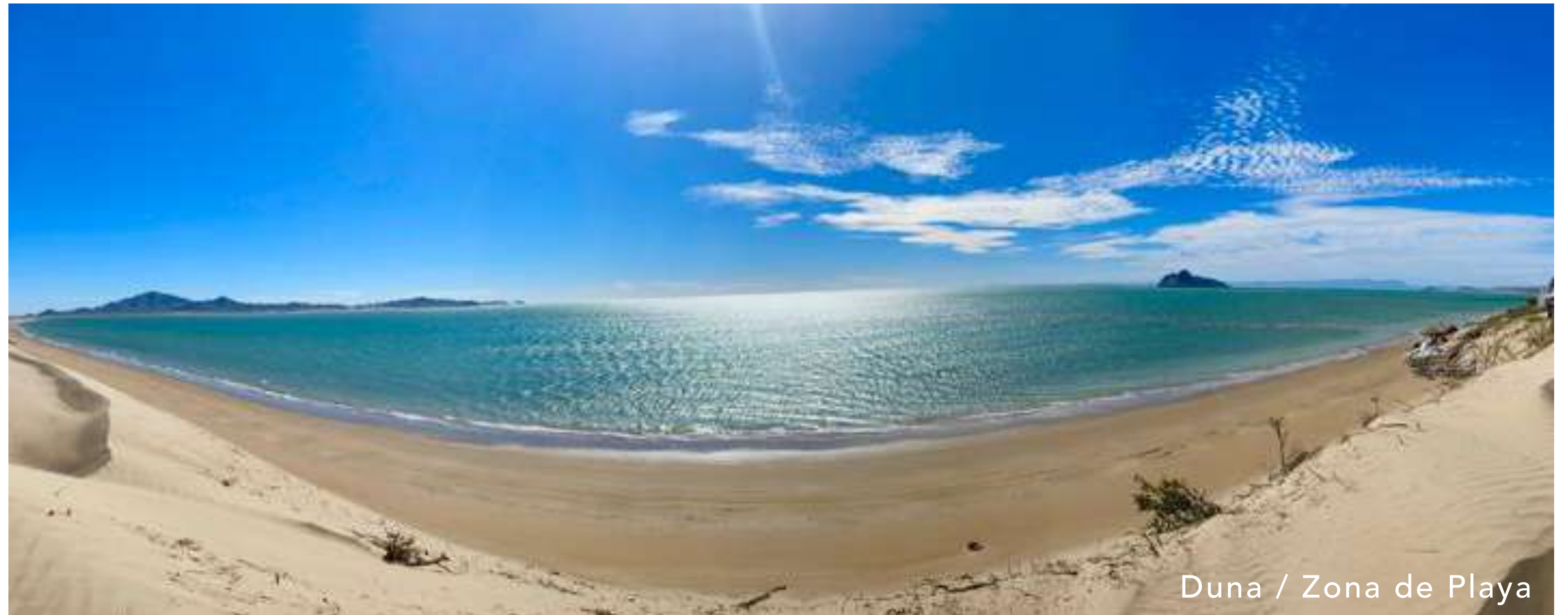
Duna / Zona de Playa