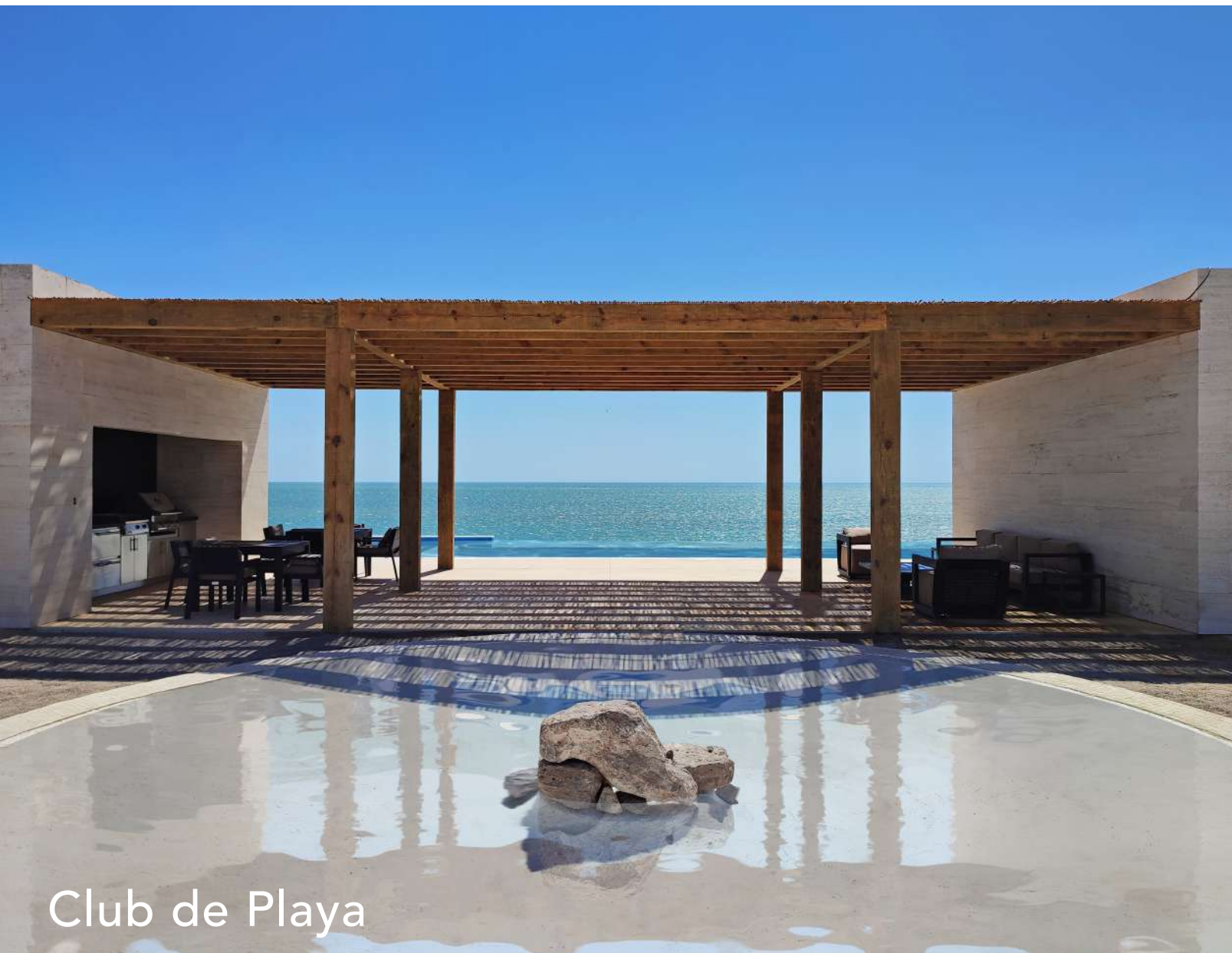
Club de Playa