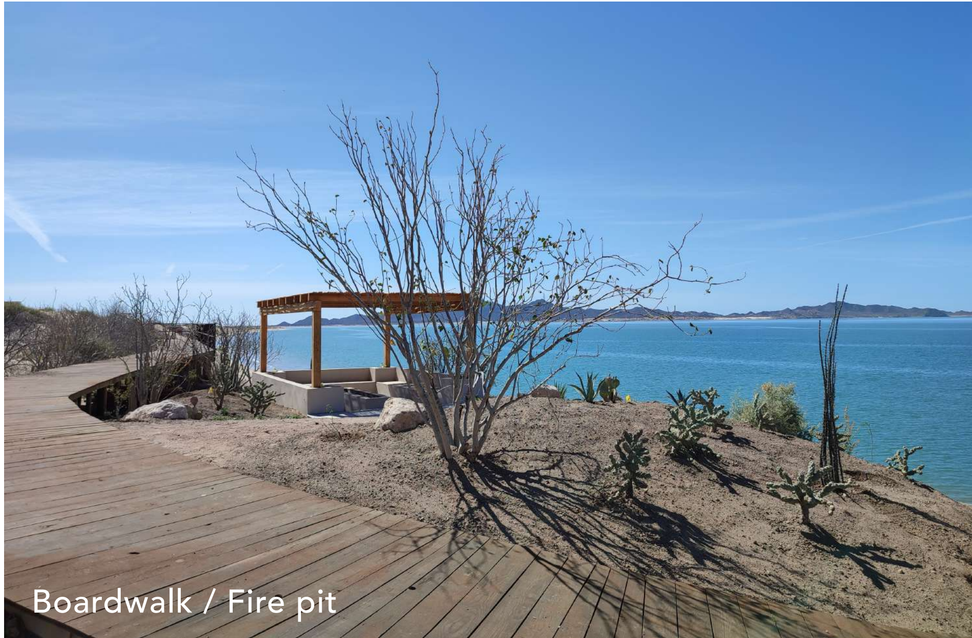
Boardwalk / Fire pit